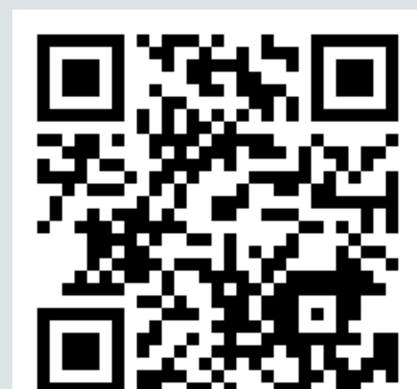
6. El Camino de Hontoria