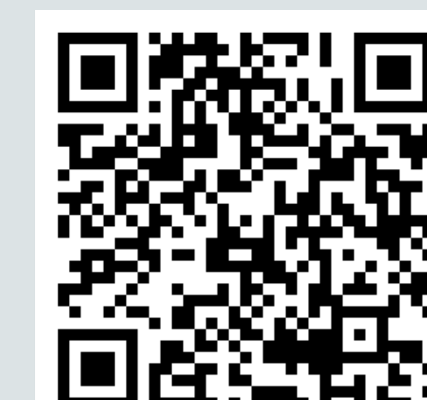
Para saber más