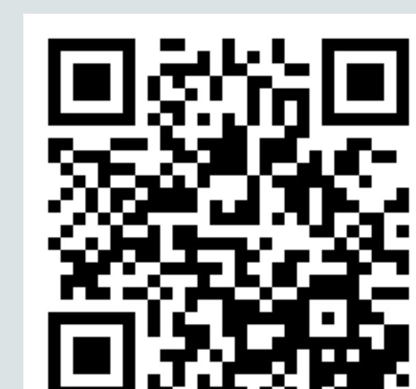
3. El camino de la Chopera