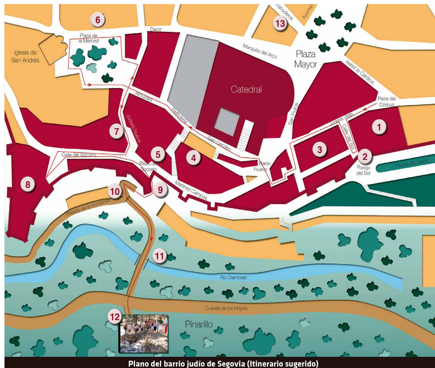
Plano del barrio judío de Segovia (Itinerario sugerido)