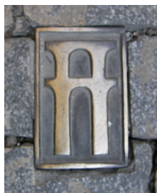
Veinticuatro placas de bronce marcan el itinerario subterráneo del Acueducto entre la plaza del Seminario y la entrada al Alcázar

El Acueducto de Segovia se divide históricamente en tres tramos bien diferenciados: