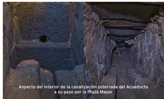
Aspecto del interior de la canalización soterrada del Acueducto a su paso por la Plaza Mayor

Tras pasar un último desarenador conocido a la entrada de los jardines del Alcázar, en la plaza de Juan Guas, llega al mismo Alcázar, punto final del trazado conocido.