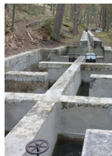
Decantador del Acueducto